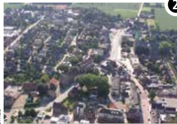
Blick auf Kirchhellen und St. Johannes