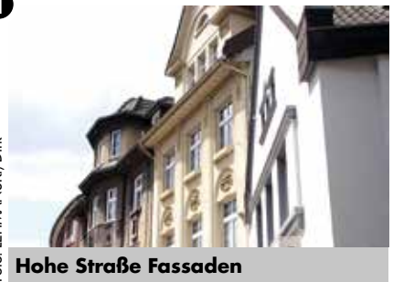
Hohe Straße Fassaden